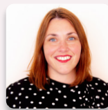
Heledd Fychan AS Plaid Cymru