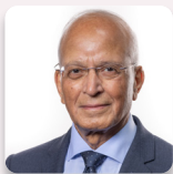
Altaf Hussain AS Ceidwadwyr Cymreig

Mynychodd yr Aelod a ganlyn fel dirprwy yn ystod yr ymchwiliad hwn.