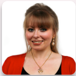
Cadeirydd y Pwyllgor: Delyth Jewell AS Plaid Cymru