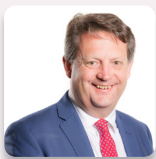
Alun Davies AS Llafur Cymru